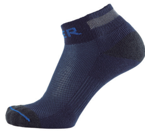
Soquete Desenho Direito/Esquerdo