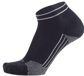
Desenho com Faixa Elástica no Pé