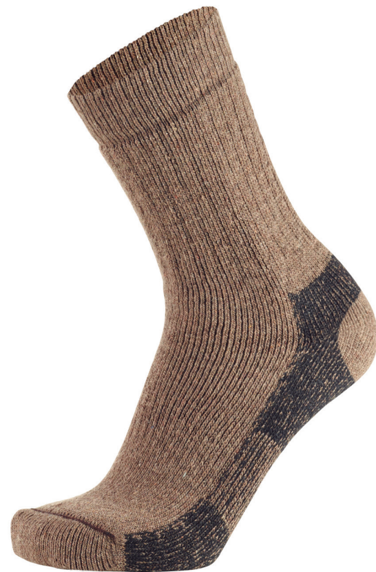
Meia Ski com Felpa Total com Desenho, Reforço na Palmilha e Faixa de Elástico Elastic with Terry, Reinforcement on Sole and Elastic Band Elástico con Toalla, Refuerzo de la Plantilla y Banda Elástico

Diseño del Puño Hasta la Pierna, Puntera con Diseño