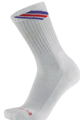
Meia Felpa com Ring Toe e Desenho

Pierna Lisa, Pie Media Toalla, 4 Alimentadores