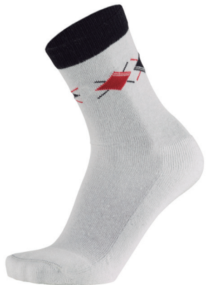
Simulação Felpa Desenhada em Reforço