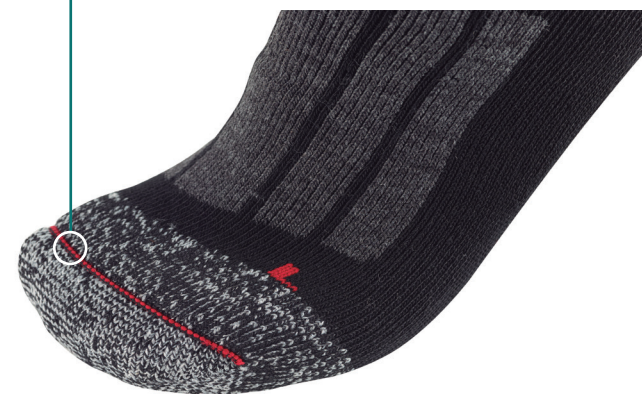
Flat Seam Flat Seam Flat Seam