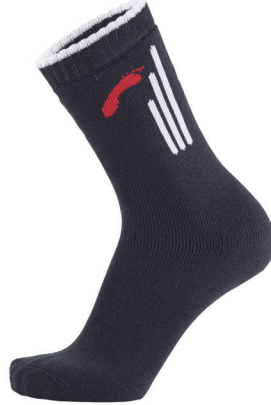
Meia Ski Técnica

Talón y Puntera con Color Diverso y en Refuerzo